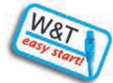
USB-Server Industry, Typ #53641